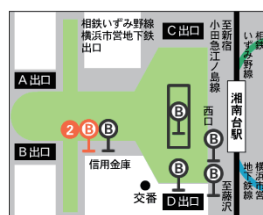
湘南台駅 (小田急線・相鉄線・横浜市営地下鉄線)

※毎日 8:30 ~ 9:00 はイトーヨーカ堂脇の停留所(7 番)になります。(休日を除く)