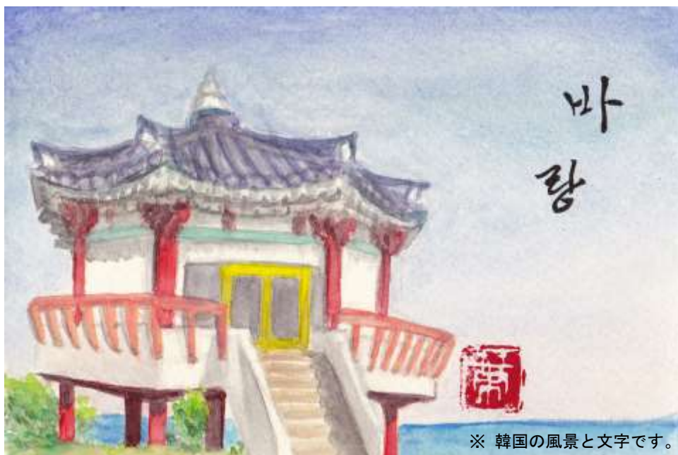
※ 韓国の風景と文字です。