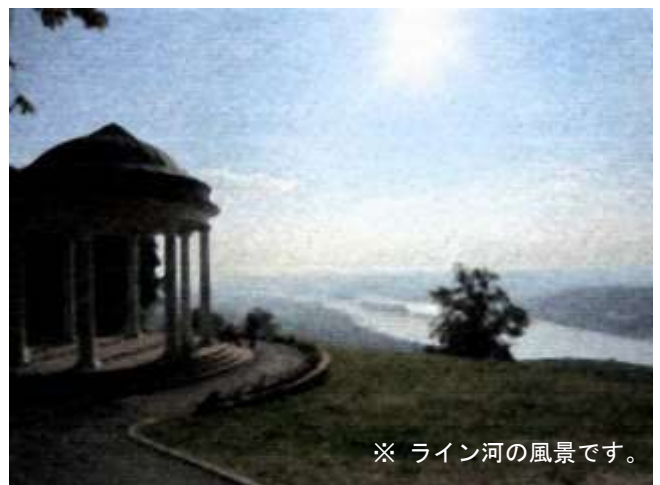
※ ライン河の風景です。