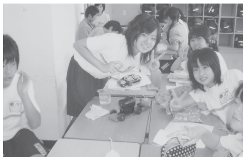
「蒸気自動車の運転」