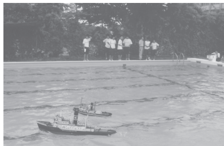
2隻の蒸気船を生徒がラジコンで操縦しているところ