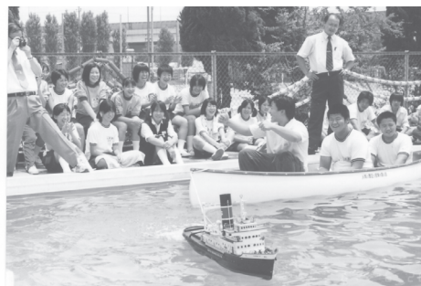
「3人の体重合計は200キロ これを模型の蒸気船が引っ張る」

会の誕生等々の分野を総合したものが産業革命の概念であるから、この授業には多くの時間をかける必要がある。