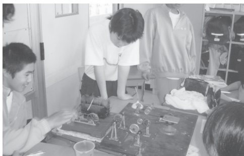
「工場模型の運転 蒸気機関が各種の工作機械を動かす」