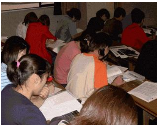
(写真2) 授業中に練習問題を解く

統計学という授業の性質上、その日のテーマに即した練習問題を授業の後半で解いてもらう(写真2)。これはプリントを配布して回