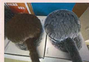
ピオトープ & クーポ (いやしロボット)