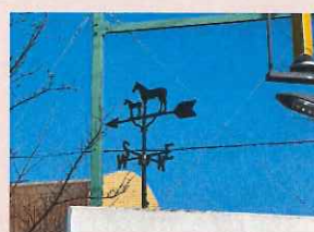
フルーベリー & 風見鶏 (銀子馬)

卒業記念品を いただきました！ 6年生の保護者の皆様 本当にありがとうございます！ 大切にしていきます。