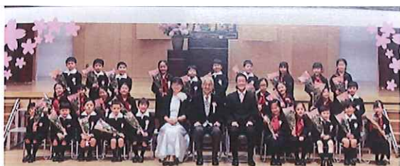
文教大学付属小学校の1年生になりました。