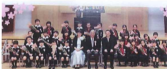
文教大学付属小学校の1年生になりました