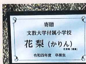
花梨(かりん) & 電子顕微鏡

卒業記念品を いただきました！ 6年生の保護者の皆様 本当にありがとうございます！ 大切にしていきます。