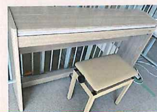
ピアノ & 運動会用万国旗