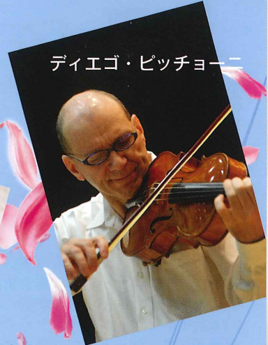
ディエゴ・ピッチョーニ