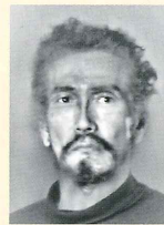
跡見梵 (虹企画 ぐるうぶ・しゆら) 警官の声