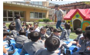
ひよこ組 初めての園庭

今年鮮やかに咲いた藤の花は、旧園舎から先人の先生たちが、心をこめて育ててきたものです。新園舎に建て替え中の二年間は別の畑に移植して、新しい植え替えの地を待ちわびていました。幹の半分近くが枯れた老木のため、誰もが花は咲かないだろうと思っていました。今年鮮やかに多くの花を咲かせてくれました。暖冬で桜の花も卒園式や入園式とは無関係に咲いていたので、新学期に満開に咲いた藤の花は、まるで子どもたちを歓迎してくれているように感じました。きっと来年も再来年も、きれいな花を咲かせてくれることでしょう。